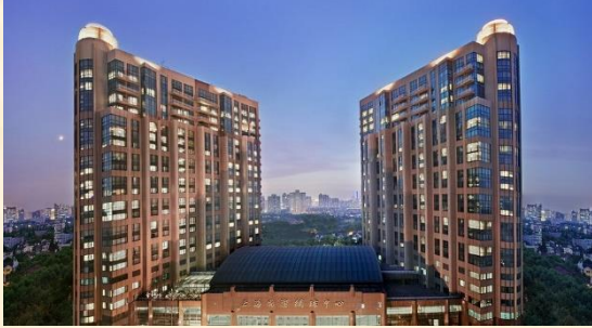
Shanghai (2 noches) Hengshan Garden Hotel 5*